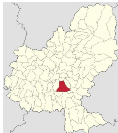
Localizarea în cadrul Județului Mureș