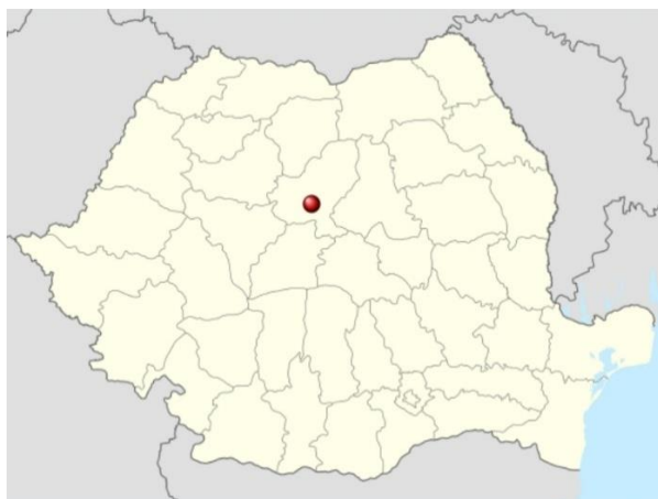
Localizarea în România